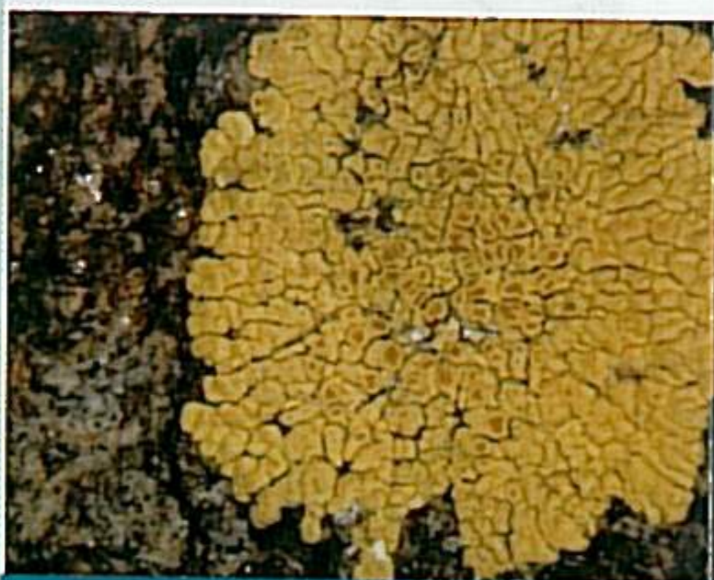
PLEOPSIDIUM FLAVUM (BELLARDI) KORB.

L'itinerario si snoda lungo il percorso Magazzino-Lac Gelé-Gran Lac-Lac Blanc e consente l'osservazione dei licheni rupicoli sulle ofioliti. Raggiunta la località Magazzino proseguite lungo il sentiero 6 in direzione Lac Gelé. Dopo un brevissimo tratto il percorso costeggia una parete verticale su cui sono presenti vistose "colate" di colore giallo-crema chiaro appartenenti al lichene crostoso Dimelaena orcina . Proseguendo su un masso di discrete dimensioni abilmente si mimetizzano i talli fogliosi grigiastri di Umbilicaria cylindrica . A breve distanza, altri fogliosi come Parmelia conspersa (colore verde-grigiastro) e P. pulla (colore bruno, lievemente lucido) rivestono il masso alla destra del sentiero. Usciti dal bosco, il percorso si snoda tra rocce che sono qua e là pennellate di giallo sia per i talli placoidi di Pleopsidium flavum sia, soprattutto, per quelli crostosi di Rhizocarpon geographicum s. lat., questi ultimi delimitati da visibili linee nere. Nei dintorni del Lac Gelé, oltre alle specie già incontrate salendo, è possibile osservare "macchie" allungate, irregolari, di colore giallo uovo appartenenti al lichene crostoso Candelariella vitellina . Meno appariscenti risultano invece le colorazioni grigiastre dei talli di Aspicilia (tra cui Aspicilia