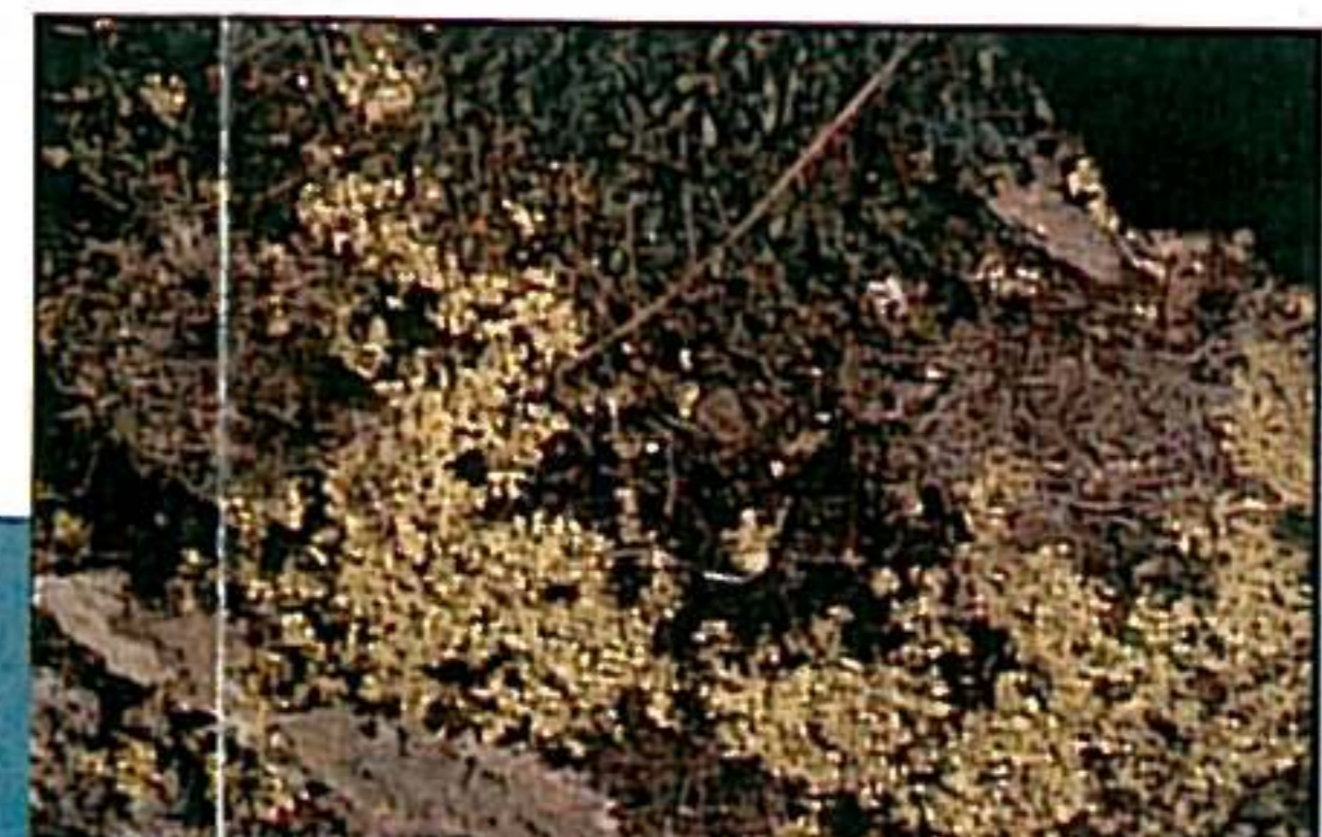
CETRARIA NIVALIS (L.) ACH